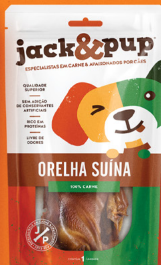
ORELHA SUÍNA 1un.