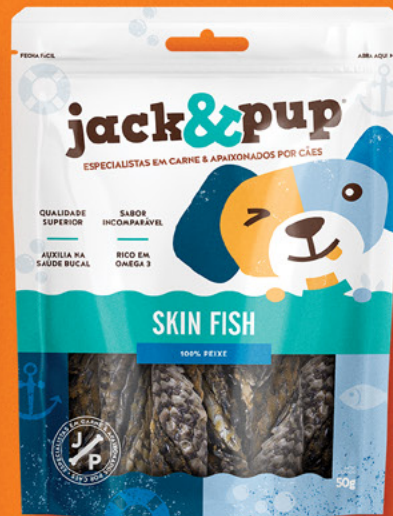
SKIN FISH 50g