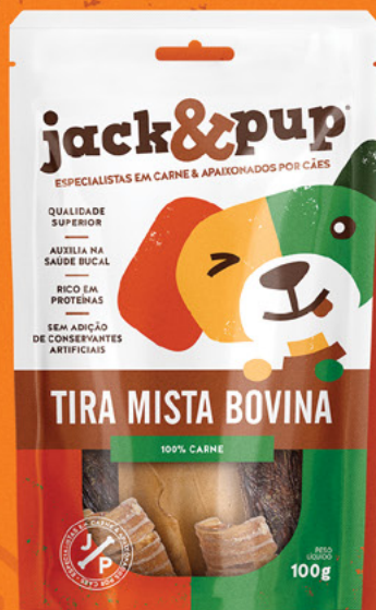
TIRA MISTA BOVINA 100g