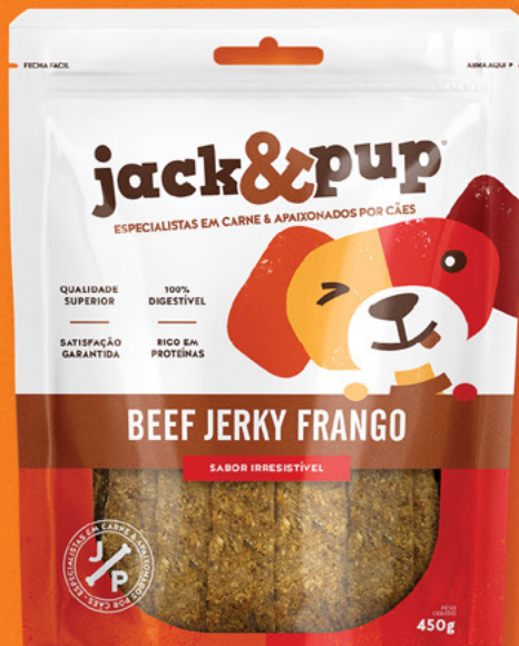
BEEF JERKY FRANGO 450g