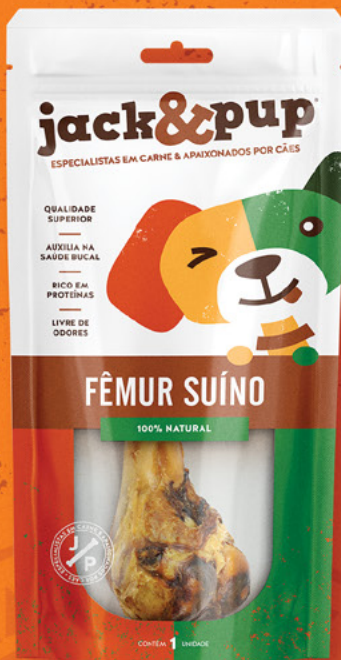
FÊMUR SUÍNO 1un.