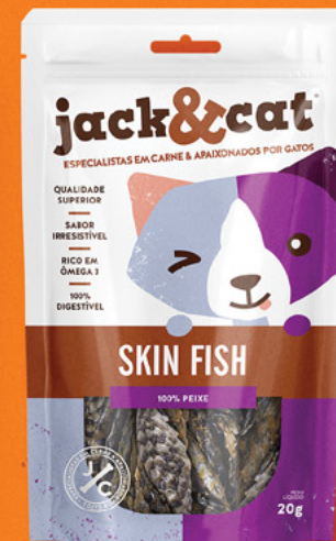
SKIN FISH GATOS 20g