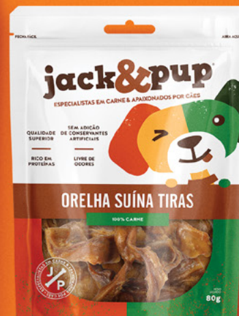
ORELHA SUÍNA TIRAS 80g