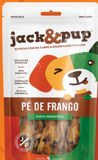
PÉ DE FRANGO 5un.