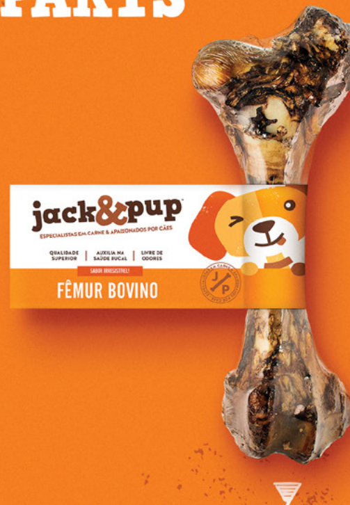
FÊMUR BOVINO 1un.