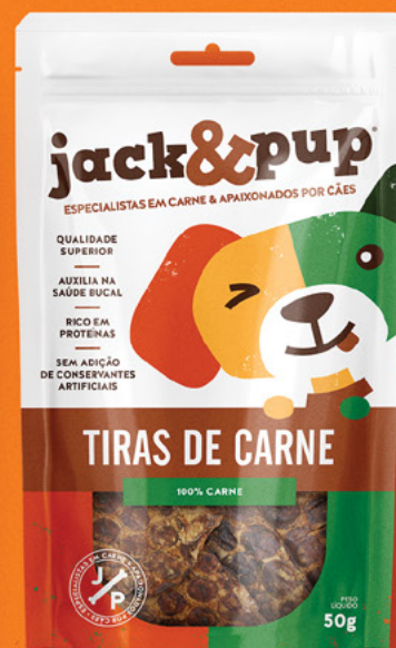
TIRAS DE CARNE 50g