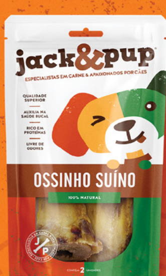
OSSINHO SUÍNO 2un.