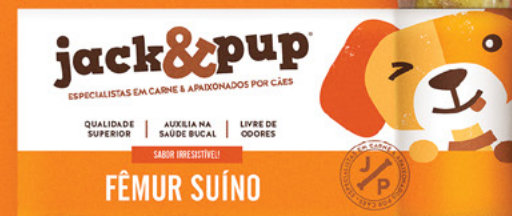
FÊMUR SUÍNO 1un.