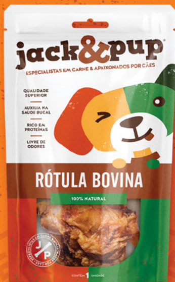
RÓTULA BOVINA 1un.