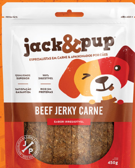
BEEF JERKY CARNE 450g