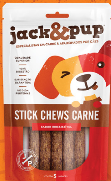
STICK CHEWS CARNE 5un.