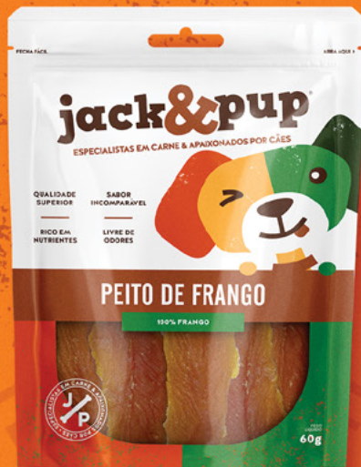
PEITO DE FRANGO 60g