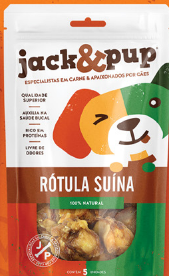
RÓTULA SUÍNA 5un.