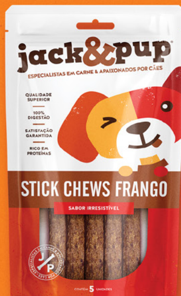
STICK CHEWS FRANGO 5un.