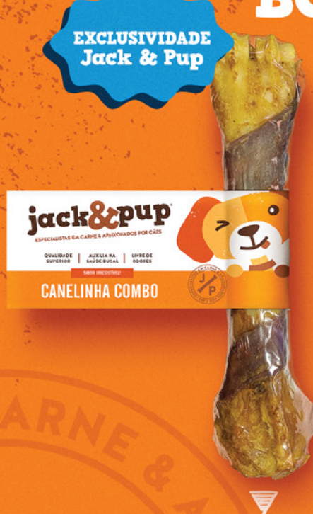
CANELINHA COMBO 1un.