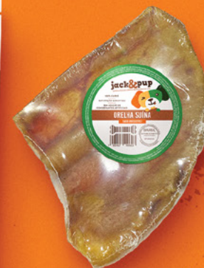
ORELHA SUÍNA 1un.