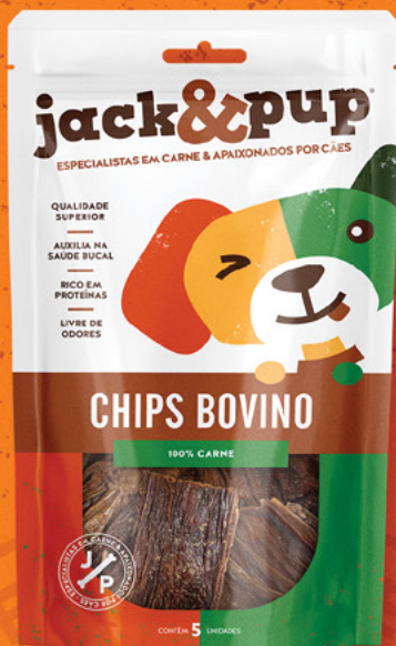
CHIPS BOVINO 5un.