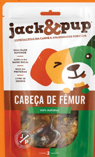
CABEÇA DE FÊMUR 2un.