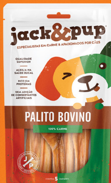
PALITO BOVINO 5un.