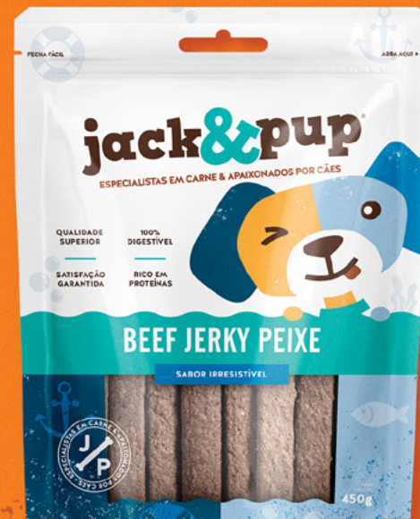
BEEF JERKY PEIXE 450g