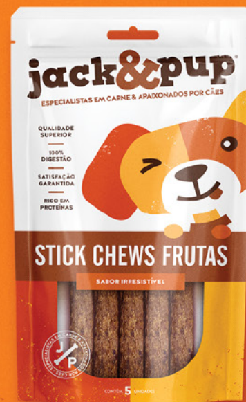
STICK CHEWS FRUTAS 5un.